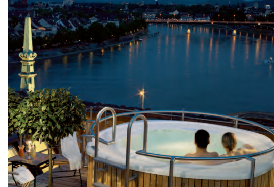
Höhepunkt im wahren Sinne: das Outdoor-Jacuzzi auf dem Dach der Suite «Les Trois Rois» mit Blick über ganz Basel.

Selbstverständlich kann das versierte Bankettteam des Les Trois Rois auch einmalige Hochzeitsarrangements anbieten. Unter dem Motto «Königliche Hochzeit» erwartet das Brautpaar und seine Gäste beim «Wedding Classic» ein Champagner-Aperitif mit exklusiven Häppchen. Anschliessend wird ein Vier-Gang-Hochzeitsmenü ganz nach den individuellen Wünschen des Paa-