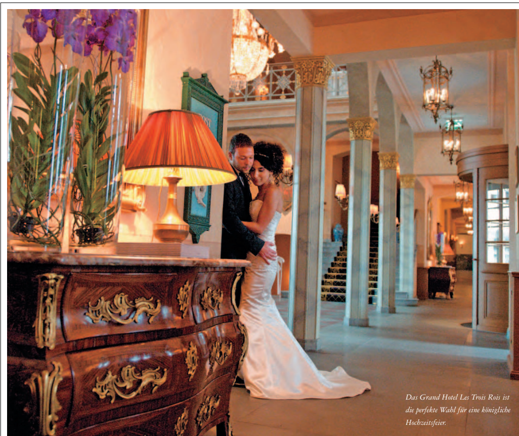
Das Grand Hotel Les Trois Rois ist die perfekte Wahl für eine königliche Hochzeitsfeier.

res serviert, wobei das Amuse Bouche eine Überraschung bleibt. Die Hochzeitstorte, die von den versierten Händen des Chef Pâtisseries kreiert wird, wird mit einem Glas Champagner zelebriert. Im Arrangement für 230 Franken pro Gast sind auch Mineralwasser und Kaffee à discrétion, der Menükartendruck mit Anlasstext und Foto sowie die festliche Tischdekoration mit Blumen aus der hauseigenen Floristik enthalten. Bei einer Festgesellschaft ab 50 Personen wird dem Brautpaar der «Salle Belle Epoque» ohne zusätzliche Raummiete zur Verfügung gestellt. Dank einem separaten Eingang können die Gäste direkt in den historischen Saal gelangen und ihre Mäntel an der bewachten Garderobe abgeben.